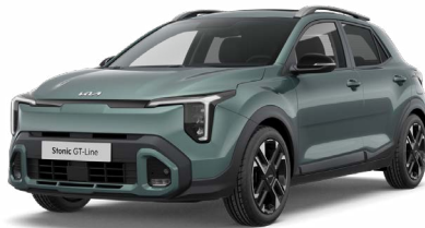
Adventurous Green Met. (A2G)