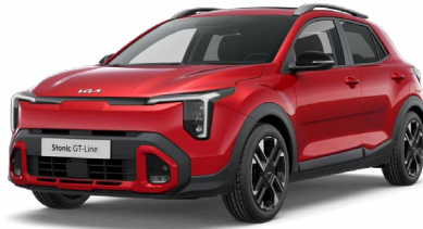
Signalrot Met. (BEG)