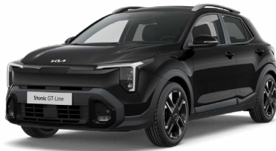
Auroraschwarz Met. (ABP)