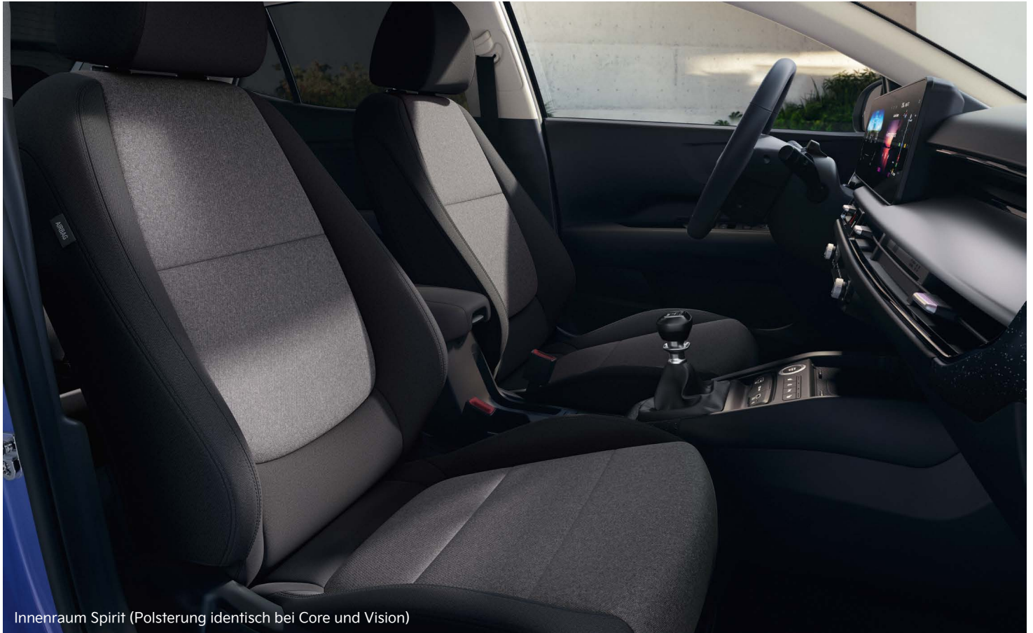
Innenraum Spirit (Polsterung identisch bei Core und Vision)

Hier kannst du dich entspannen: Für den Kia Stonic stehen Sitzbezüge aus Stoff oder Stoff in Kombination mit Ledernachbildung zur Wahl.