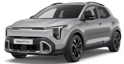
Sparklingsilber Met. (KCS)