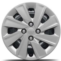
15-Zoll-Stahlfelgen mit Radzierblende (Core)

Bei einigen unserer modernen Metallicfarben werden bewusst unterschiedliche Farbpigmente verwendet. Dadurch können unter bestimmten Lichtverhältnissen, z.B. direktes Sonnenlicht, attraktive Farbeffekte erzielt werden. Zum Teil kann die Farbe changieren, z.B. von Schwarz zu Dunkelblau. Bei den hier abgebildeten Farbdarstellungen kann es aufgrund der Drucktechnik zu Abweichungen zu den Originalfarben kommen. Weitere Informationen zu den Farbeffekten und Grundfarben erhältst du bei deinem Kia-Partner. Metalliclackierungen sind aufpreispflichtig.