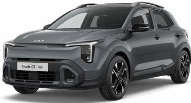
Astrograu Met. (M7G)