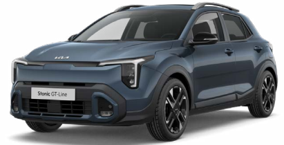
Denimblau Met. (EU3)