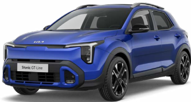
Yachtblau Met. (DU3)